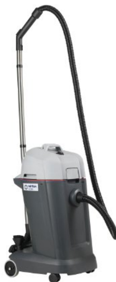
A kép illusztrációként szolgál.

A száraz-nedves porszívók VL 500 sorozata kiváló teljesítményt és megbízhatóságot nyújt, és alacsony üzemeltetési költséget biztosít a felhasználók számára. Ugyanakkor a napi tisztítási feladatok könnyebben, gyorsabban és biztonságosabban elvégezhetők.